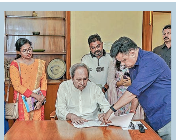
భవనేశ్వర్లో 'స్పెషల్ ఇంజిన్యూవ్ రివిజన్' గణన పత్రంపై సంతకం చేస్తున్న బీజేపీ జనతా డి.ఆధ్యక్షుడు నవీన్ పట్నాయక్