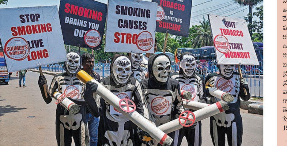
ప్రపంచ పొగాకు వ్యతిరేక దినోత్సవం సందర్భంగా ఆదివారం కోల్ కత్తోల్ అవగాహన ప్రదర్శన దృశ్యం