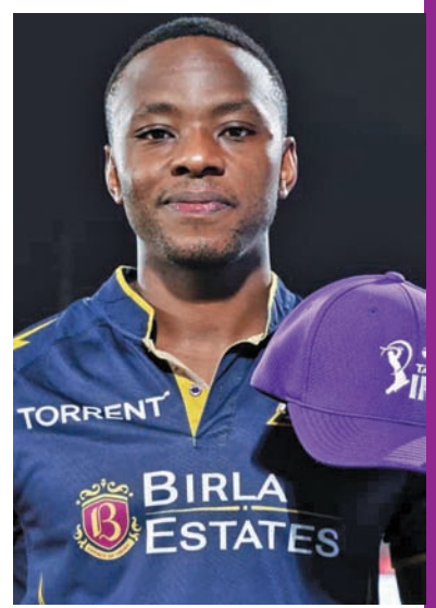
కరీసా రబబ్ 17 మ్యాచ్లు, 29 వికెట్లు బెస్ట్: 3-25, ఎకానమీ: 9.68 ఓవర్లు: 65, రన్స్: 626