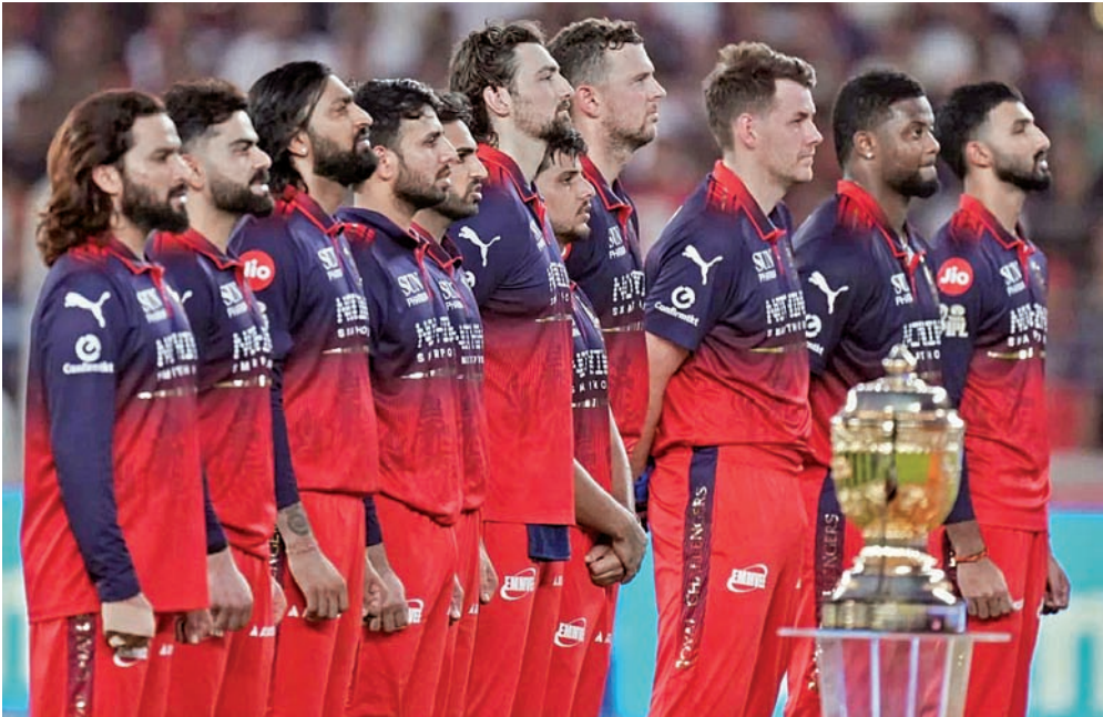
గిల్, సుదర్శన్ ఛేజింగ్ మొదలైన కచ్చాలు

156 పరుగుల స్వల్ప లక్ష్యంతో బ్యాటింగ్ కు దిగిన ఆర్నీబీ ఓవర్లు వెంటనే అయ్యాయి (16 బంతుల్లో 32, 4 షోర్టు, 2 సిక్స్లు), ఛేజింగ్ కింగ్